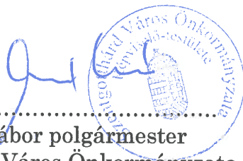
Huszár Gábor polgármester Szentgotthárd Város Önkormányzata mint székhelytelepülés szerinti tag képviselője