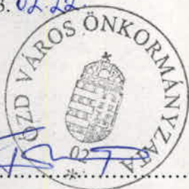
Fürjes Pál polgármester Ózd Város Önkormányzata