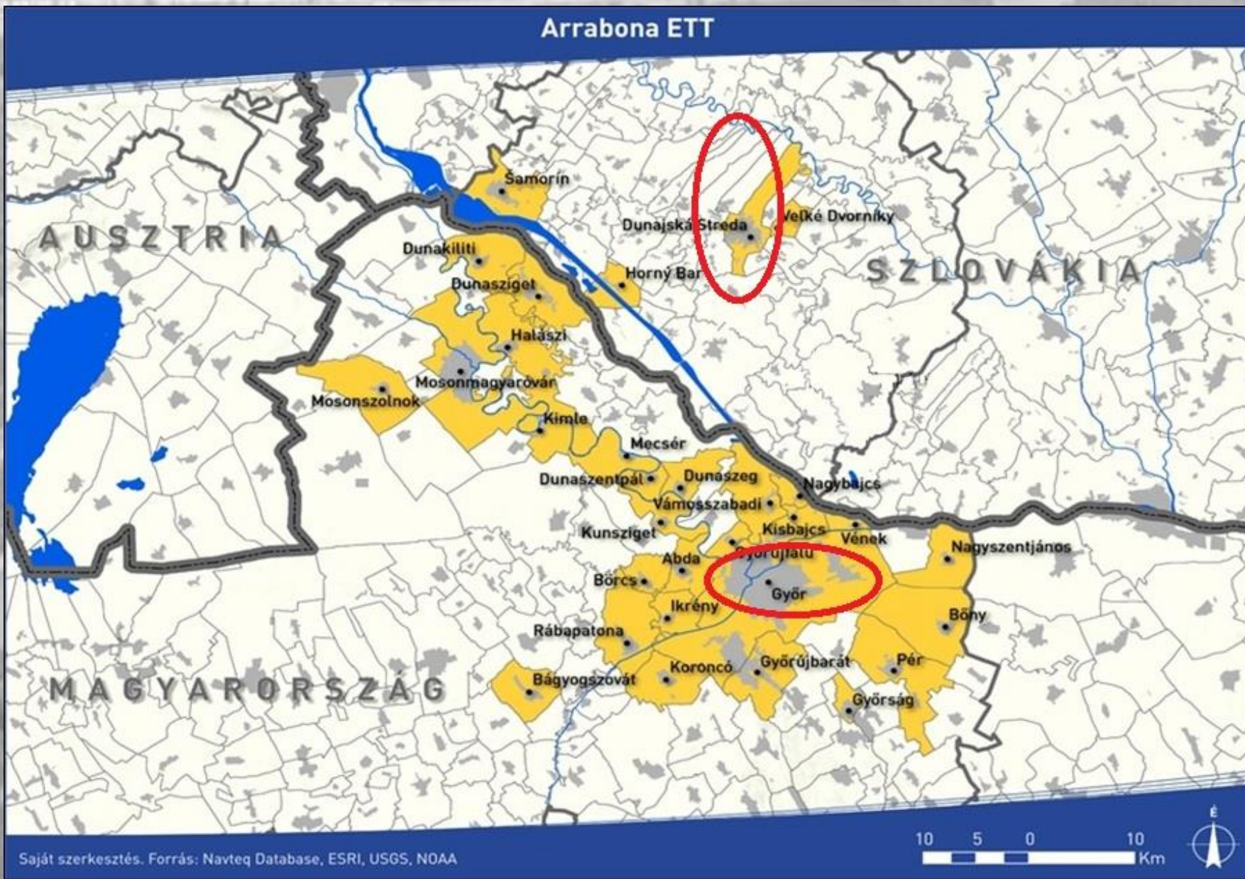
2. Ábra Győr és Dunaszerdahely elhelyezkedése